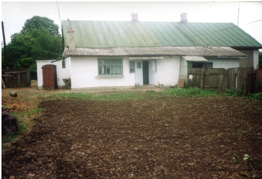
Bývalý dům Hajných v Máslence – současná podoba.

cirkusy a herny, kde bylo možno peníze nebo něco jiného vyhrát a také prohrát a to spíš.